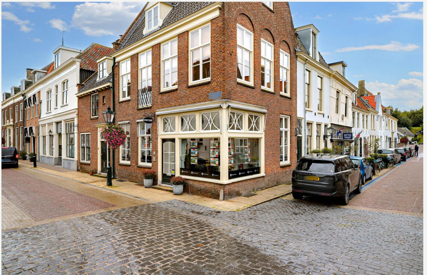
Hartje centrum Naarden Vesting