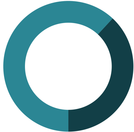
Koop / huur

0 - 14: 16% 15 - 24: 10% 25 - 44: 30% 45 - 64: 24% 65+: 21%